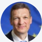
Stephan Toscani Minister für Finanzen und Europa