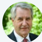
Philippe Richert Präsident der Region Grand Est, Minister a. D. „Die grenzüberschreitenden Beziehungen als Faktor für die Attraktivität der Region Grand Est“